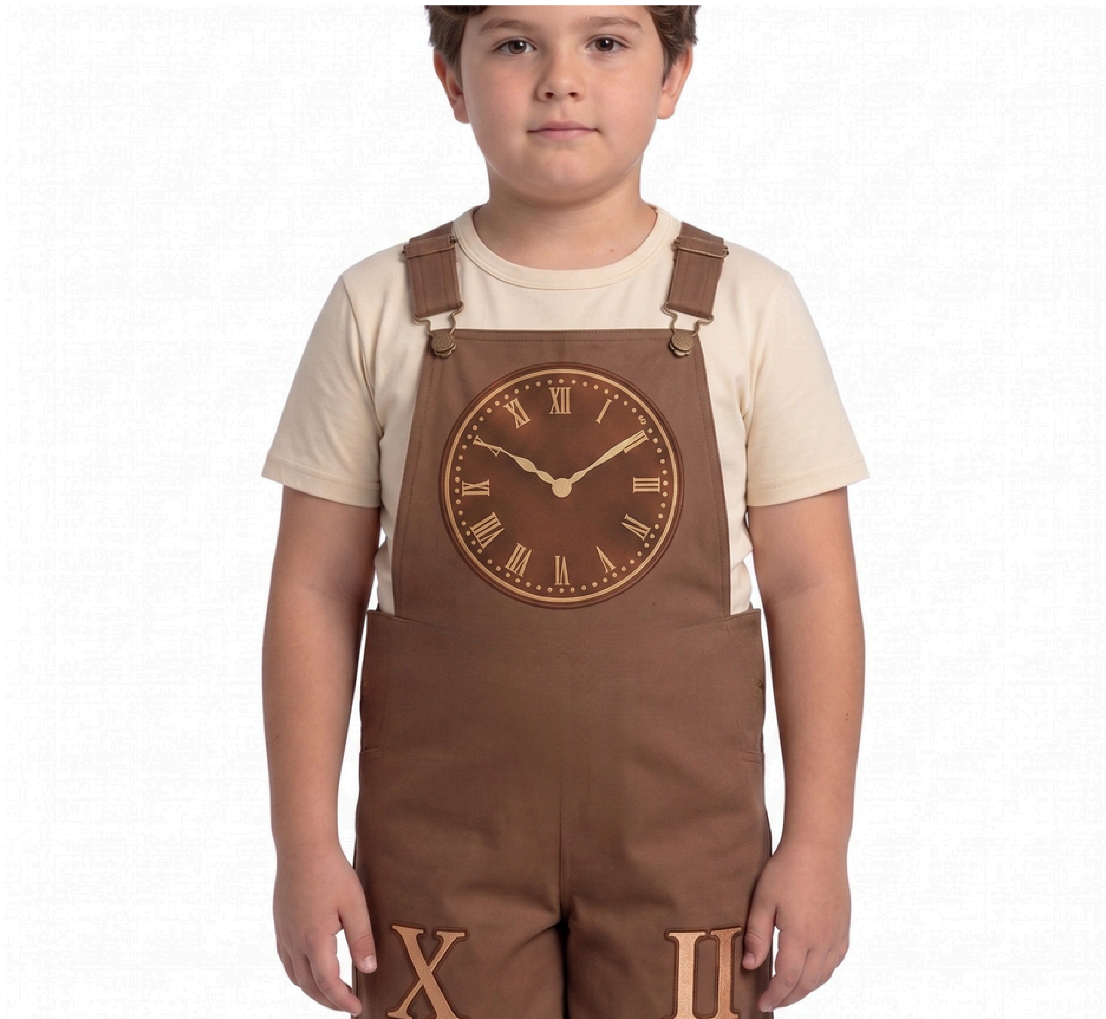
IMAGEM GERADA POR IA MERAMENTE ILUSTRATIVA