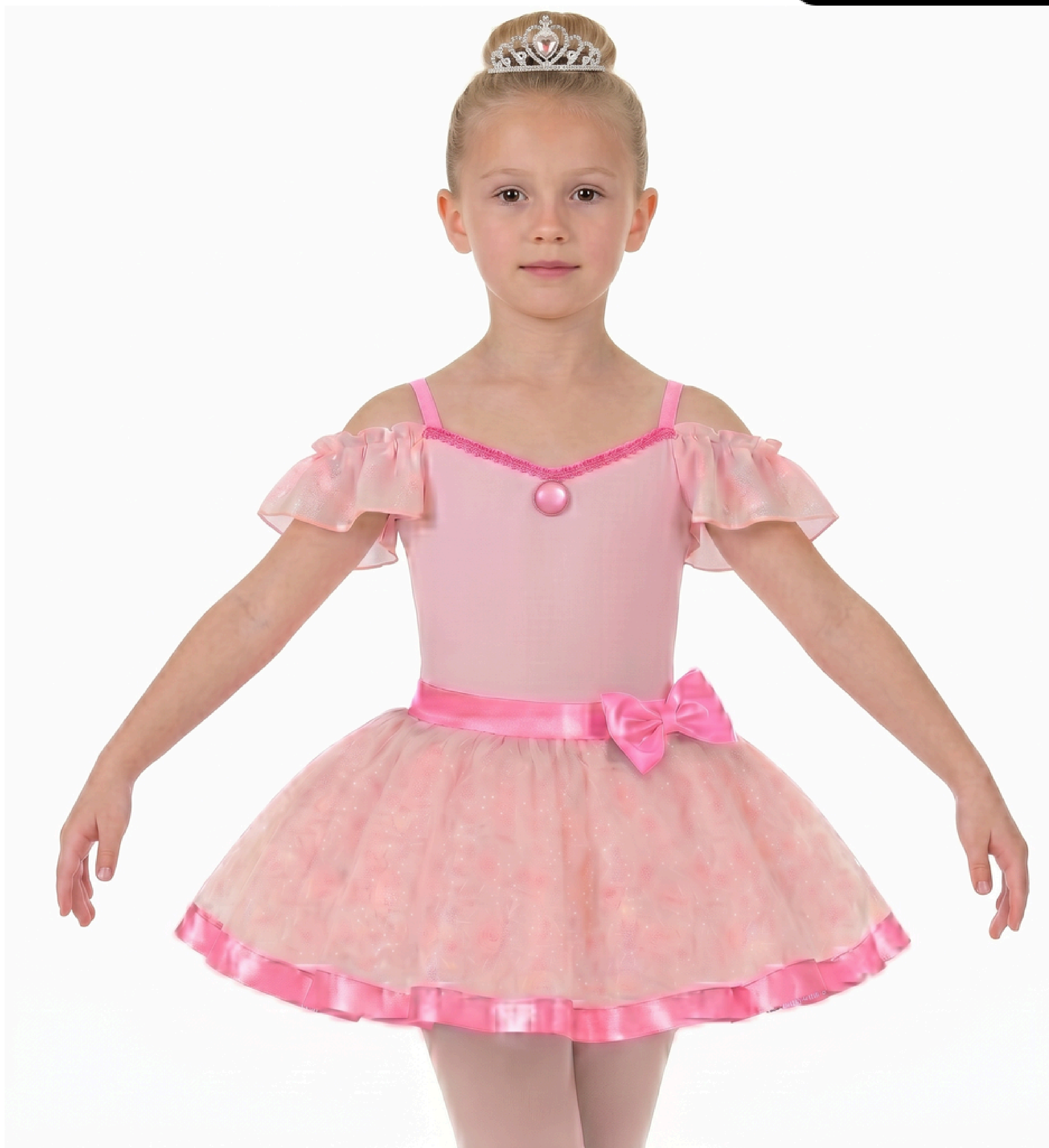
IMAGEM GERADA POR IA MERAMENTE ILUSTRATIVA