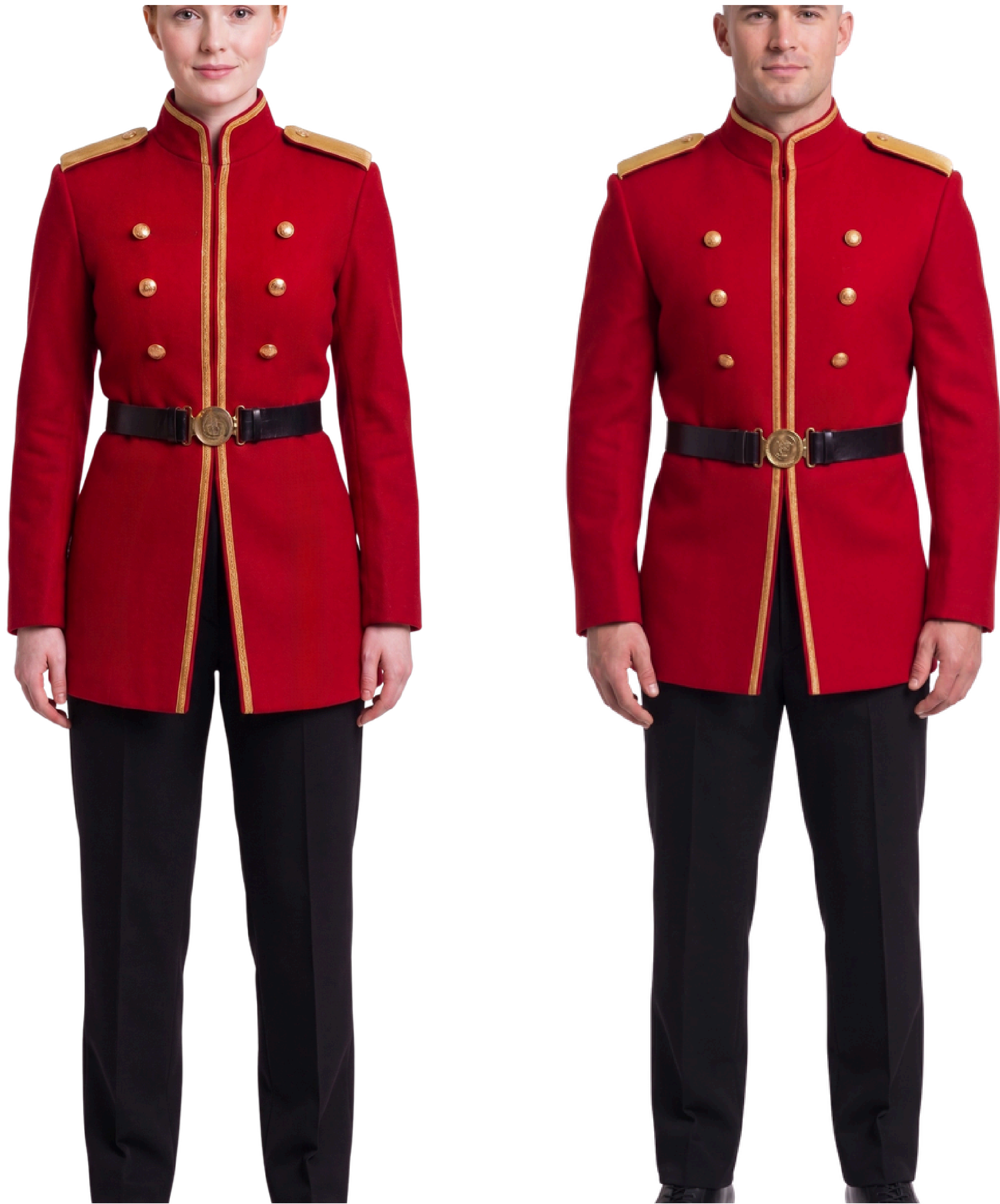
IMAGEM GERADA POR IA MERAMENTE ILUSTRATIVA