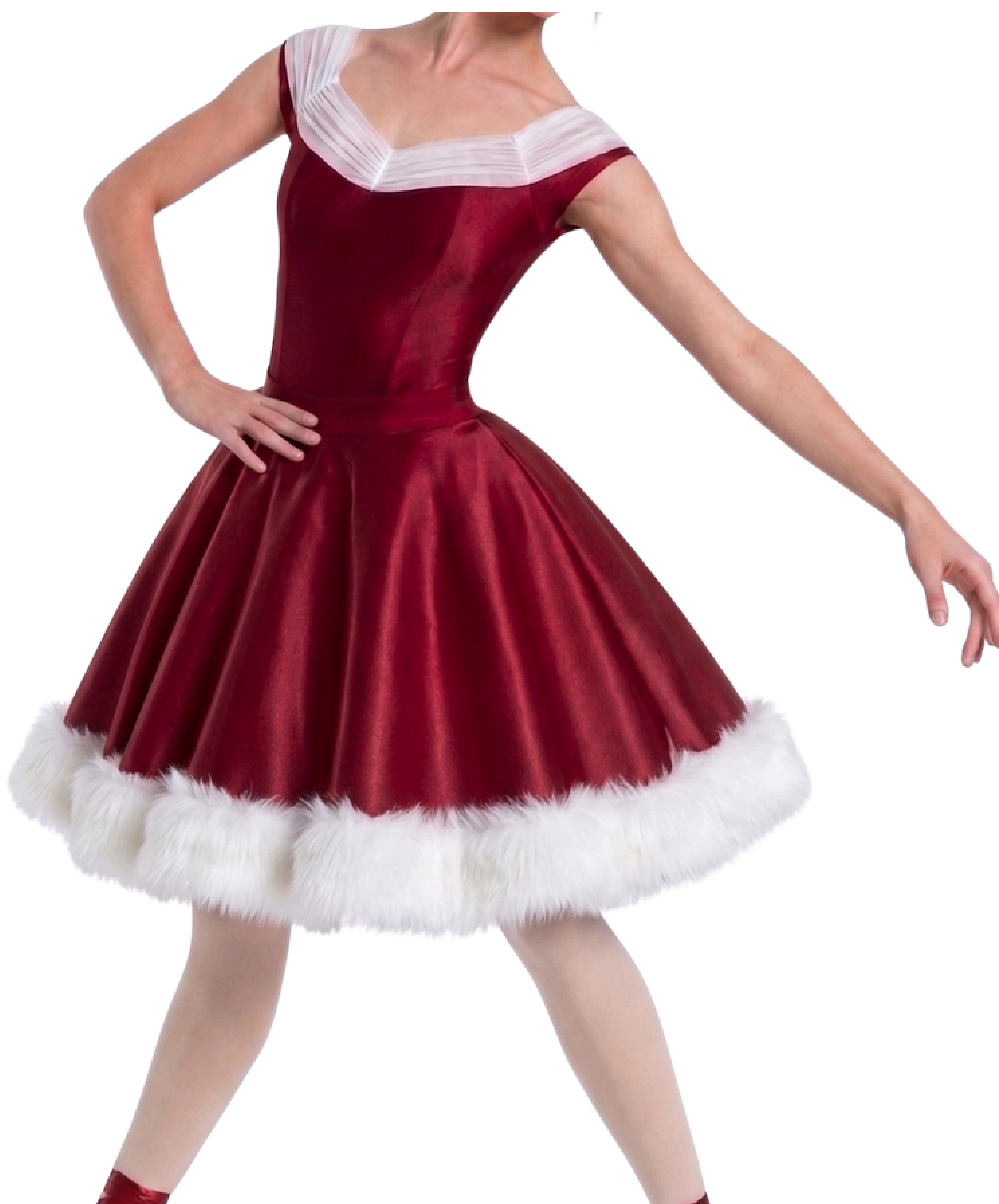
IMAGEM GERADA POR IA MERAMENTE ILUSTRATIVA