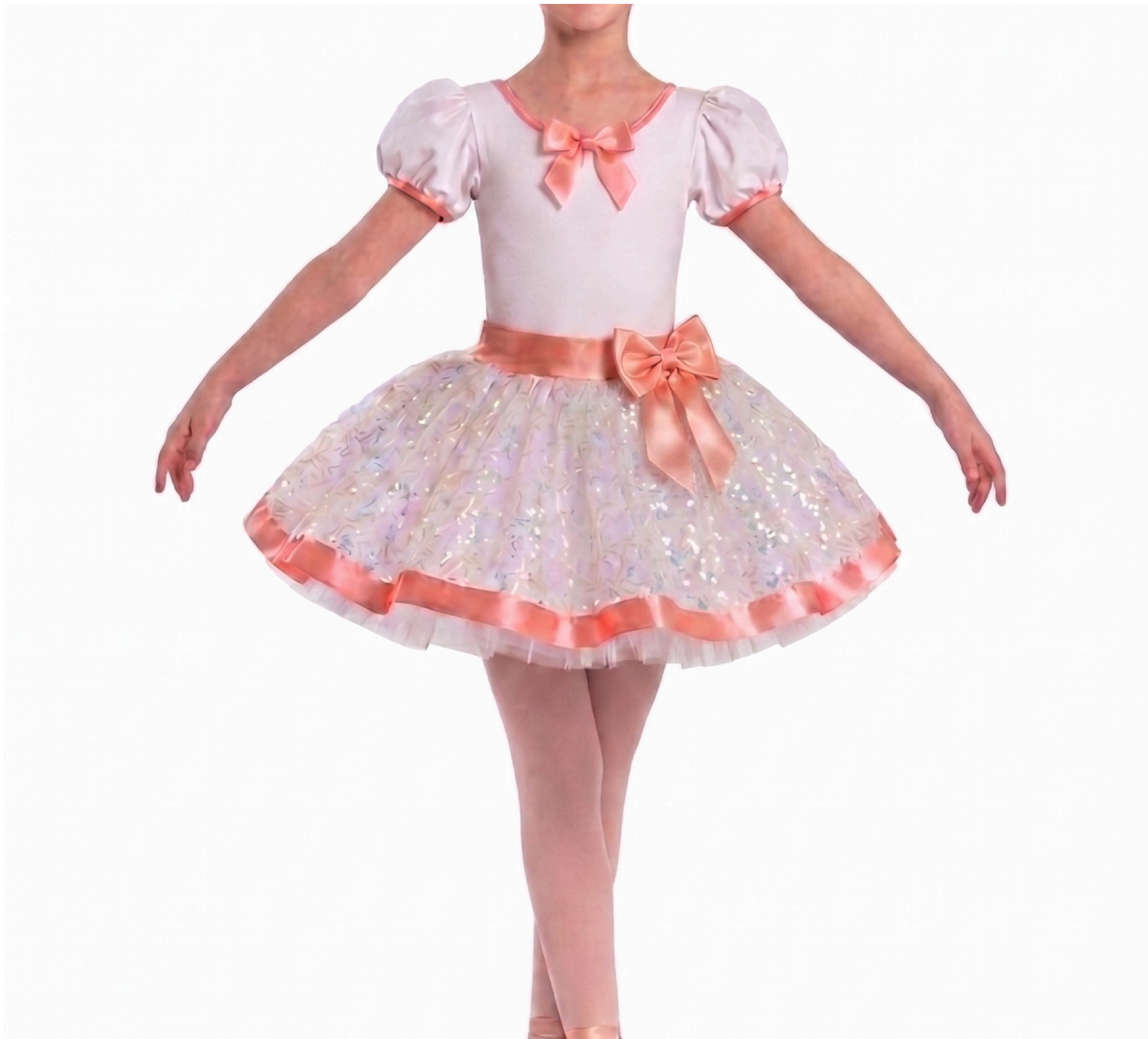
IMAGEM GERADA POR IA MERAMENTE ILUSTRATIVA