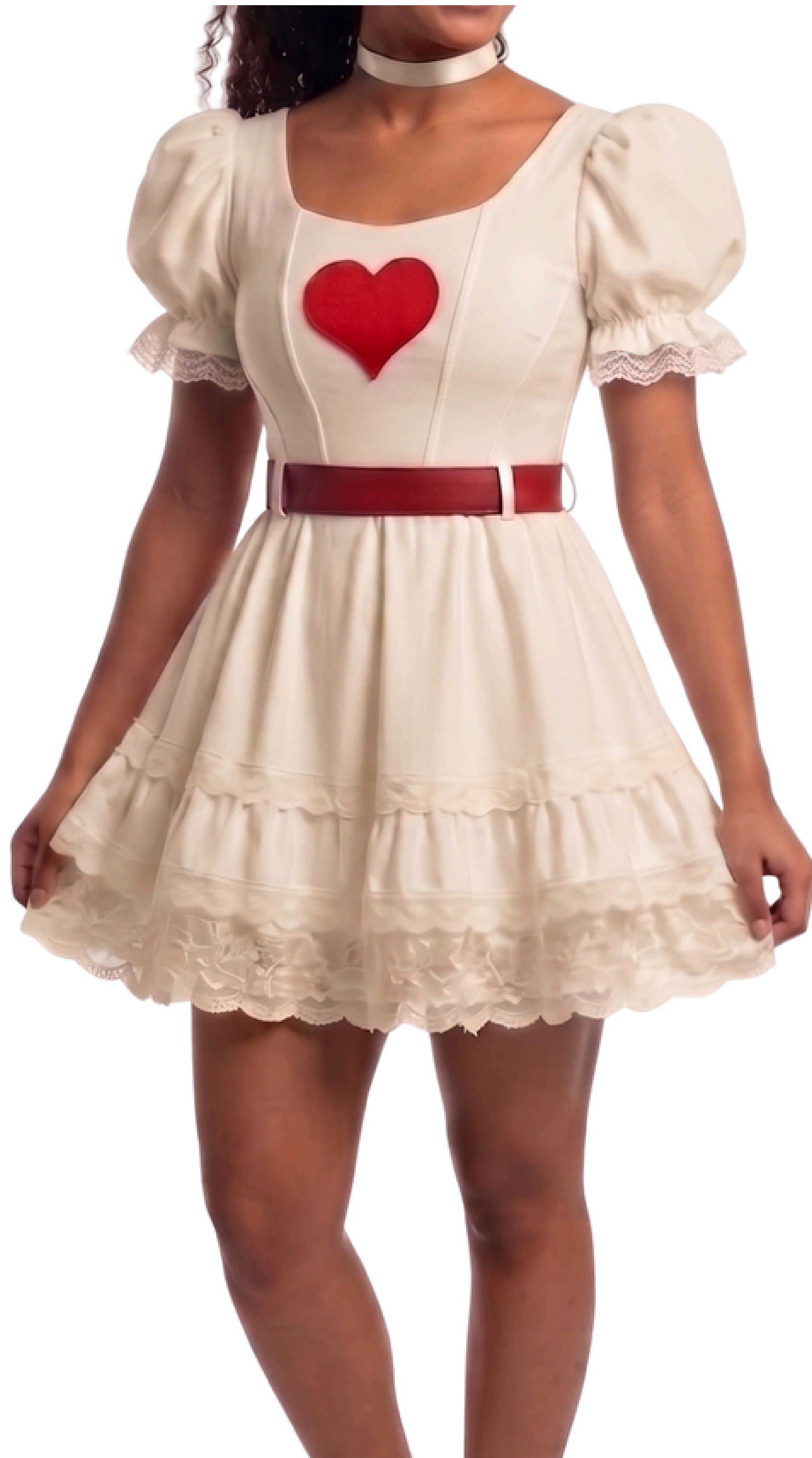
IMAGEM GERADA POR IA MERAMENTE ILUSTRATIVA