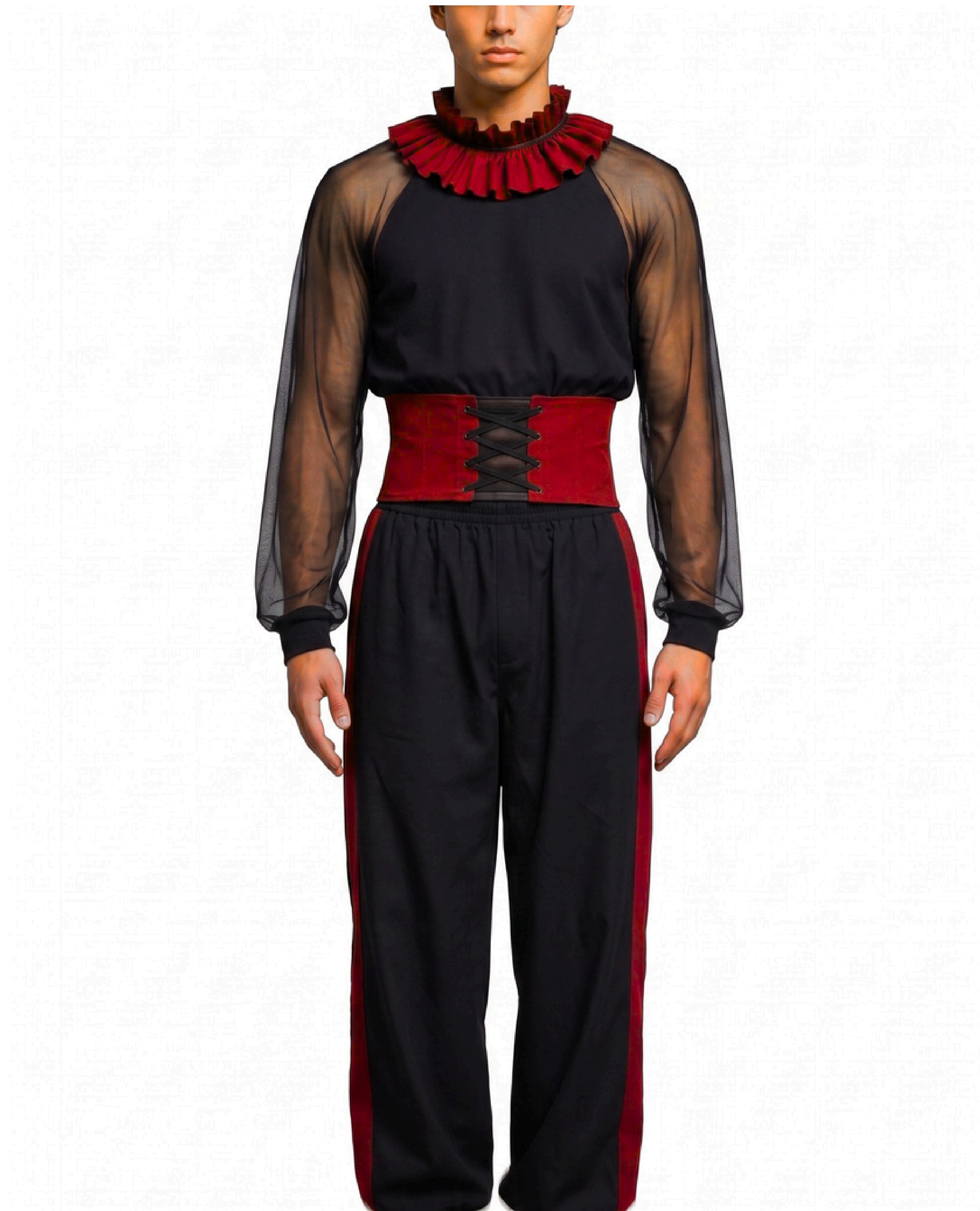
IMAGEM GERADA POR IA MERAMENTE ILUSTRATIVA