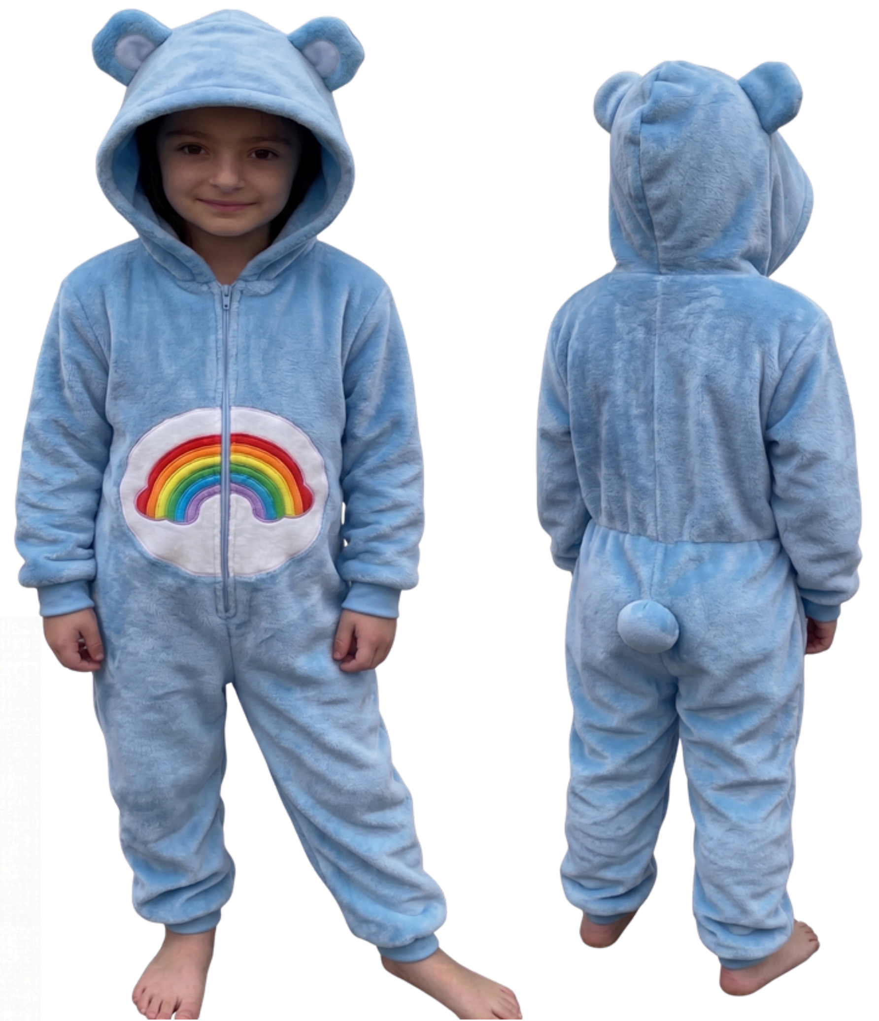
IMAGEM GERADA POR IA MERAMENTE ILUSTRATIVA