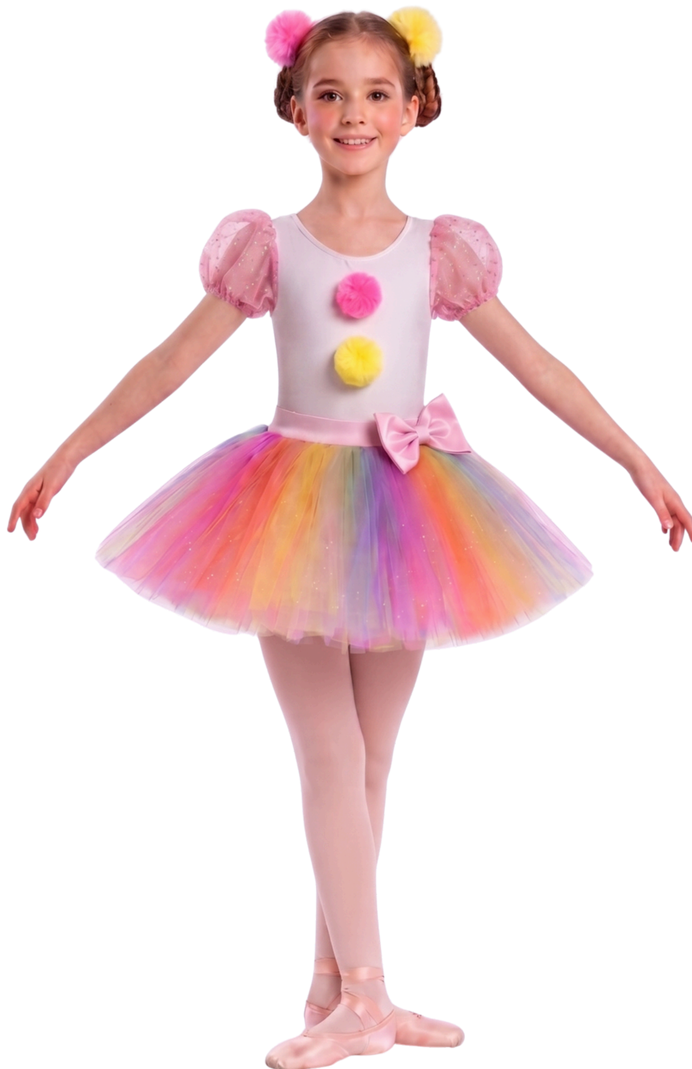
IMAGEM GERADA POR IA MERAMENTE ILUSTRATIVA