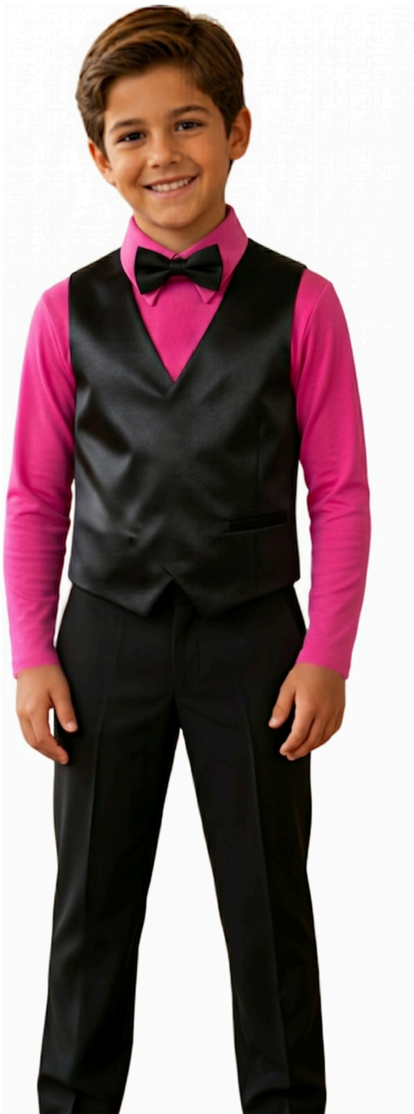
IMAGEM GERADA POR IA MERAMENTE ILUSTRATIVA