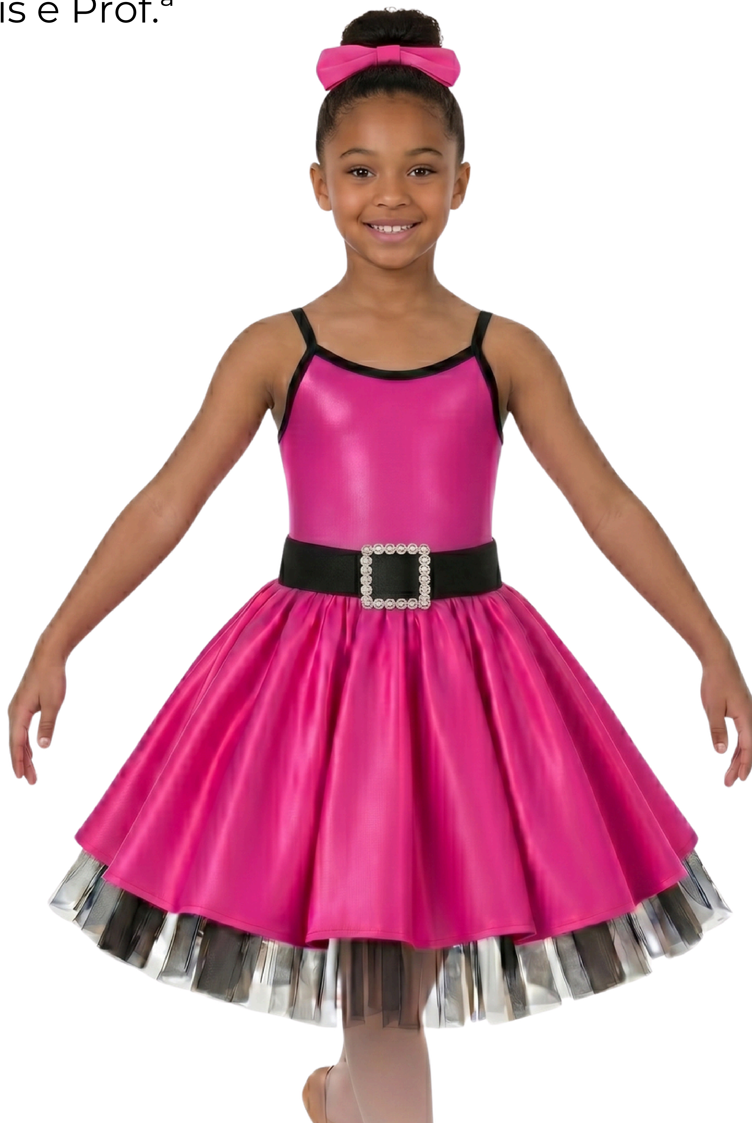
IMAGEM GERADA POR IA MERAMENTE ILUSTRATIVA