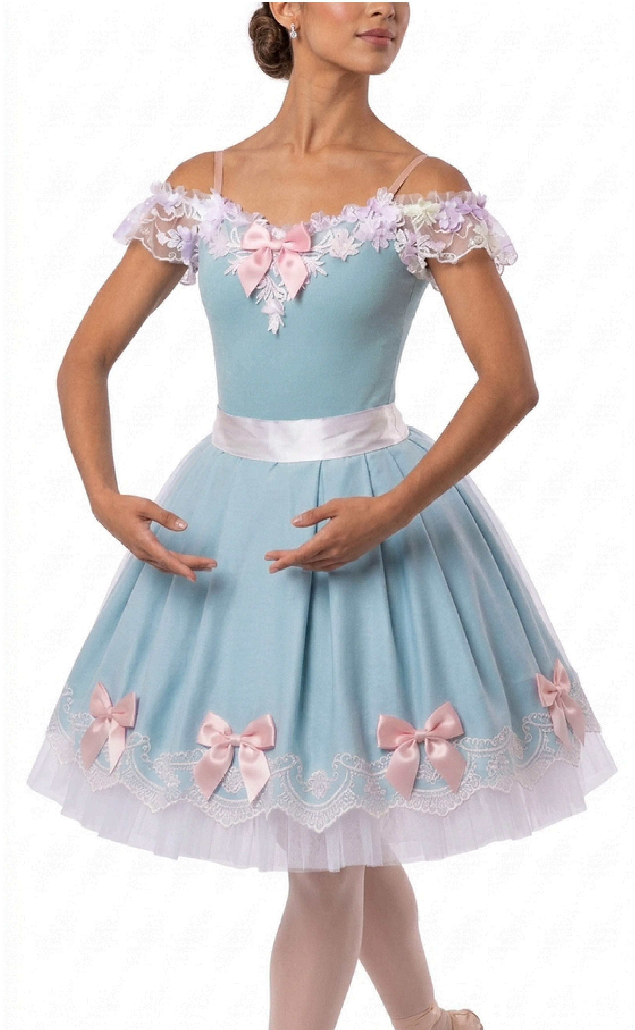
IMAGEM GERADA POR IA MERAMENTE ILUSTRATIVA