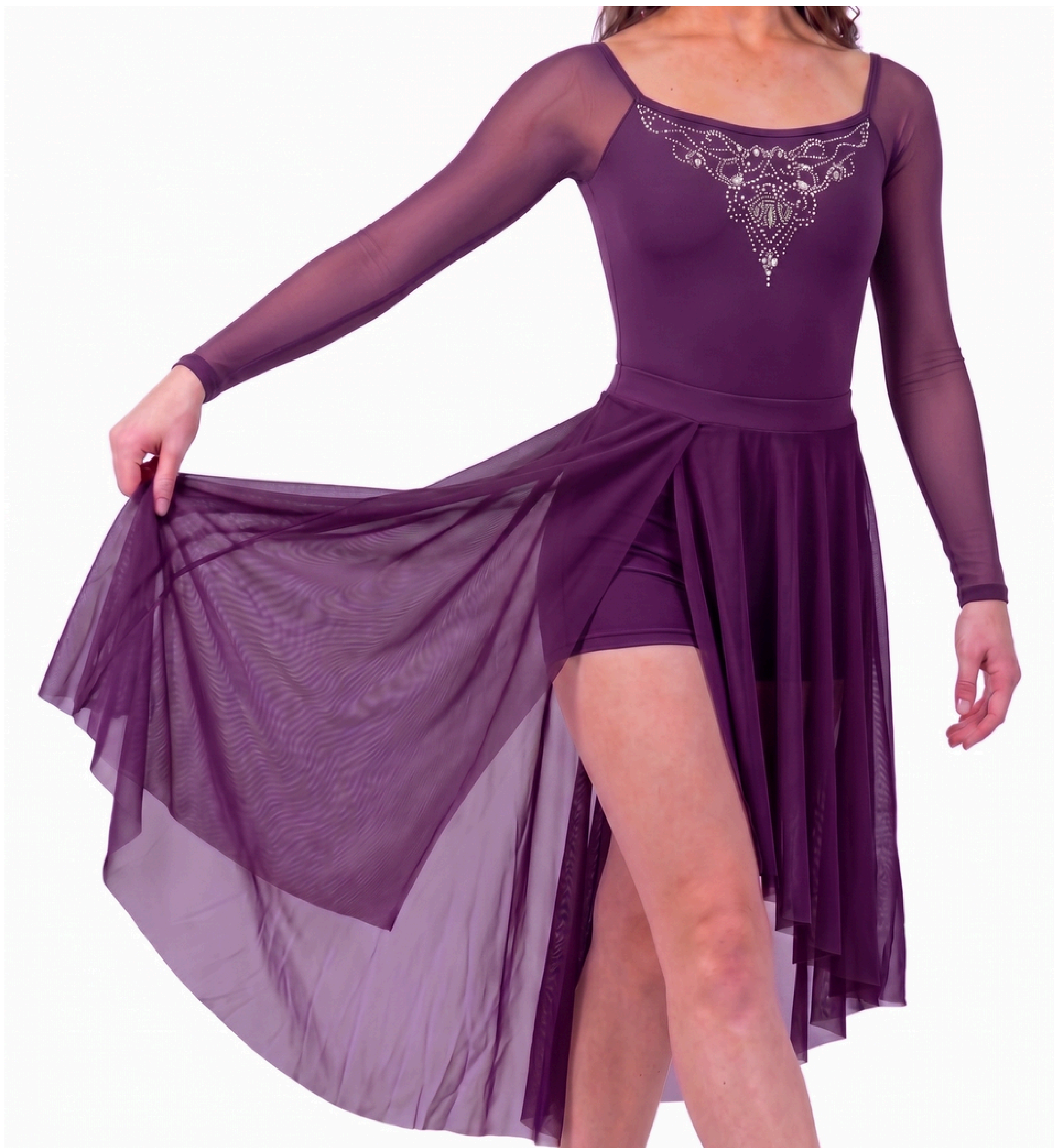
IMAGEM GERADA POR IA MERAMENTE ILUSTRATIVA