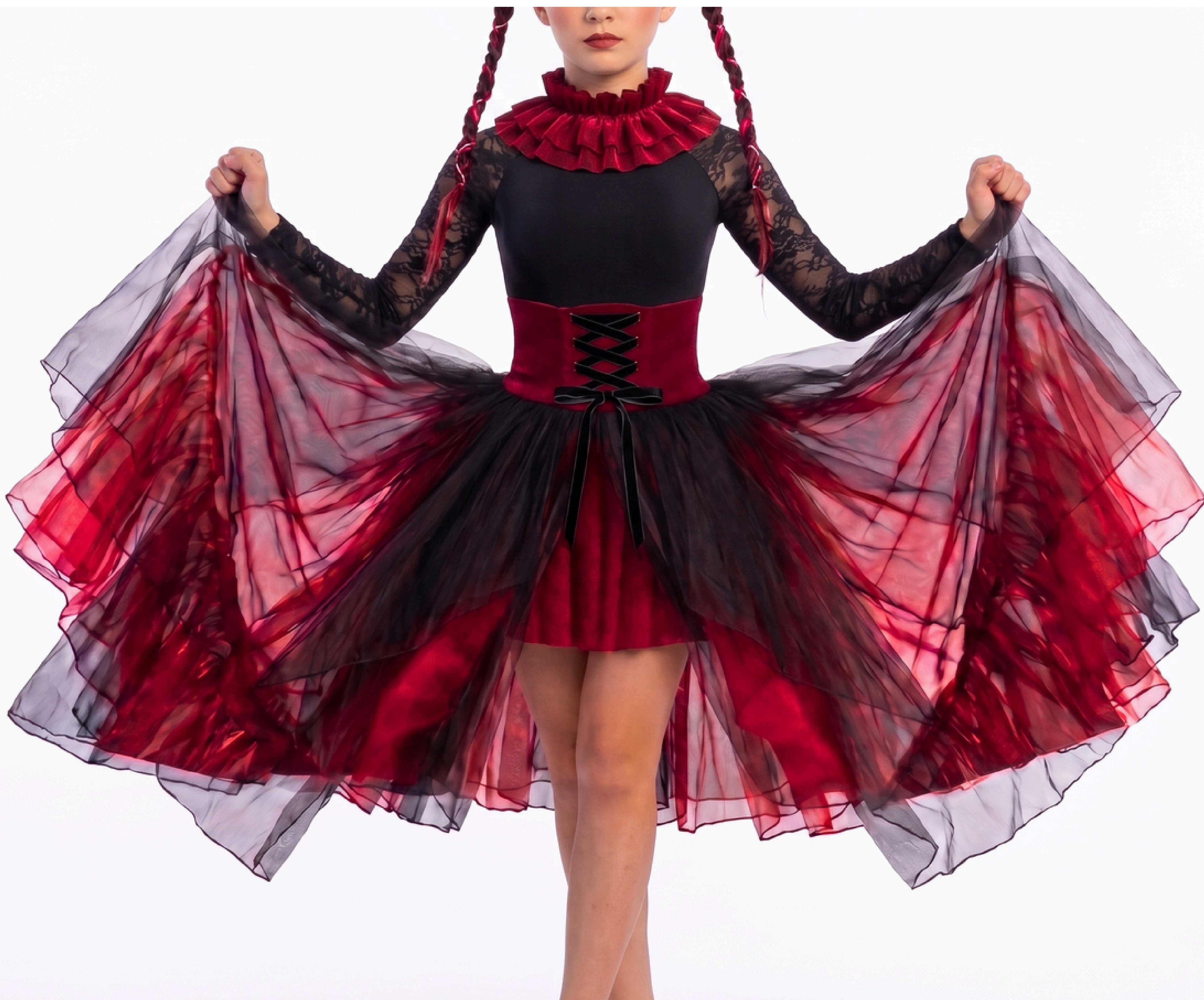
IMAGEM GERADA POR IA MERAMENTE ILUSTRATIVA