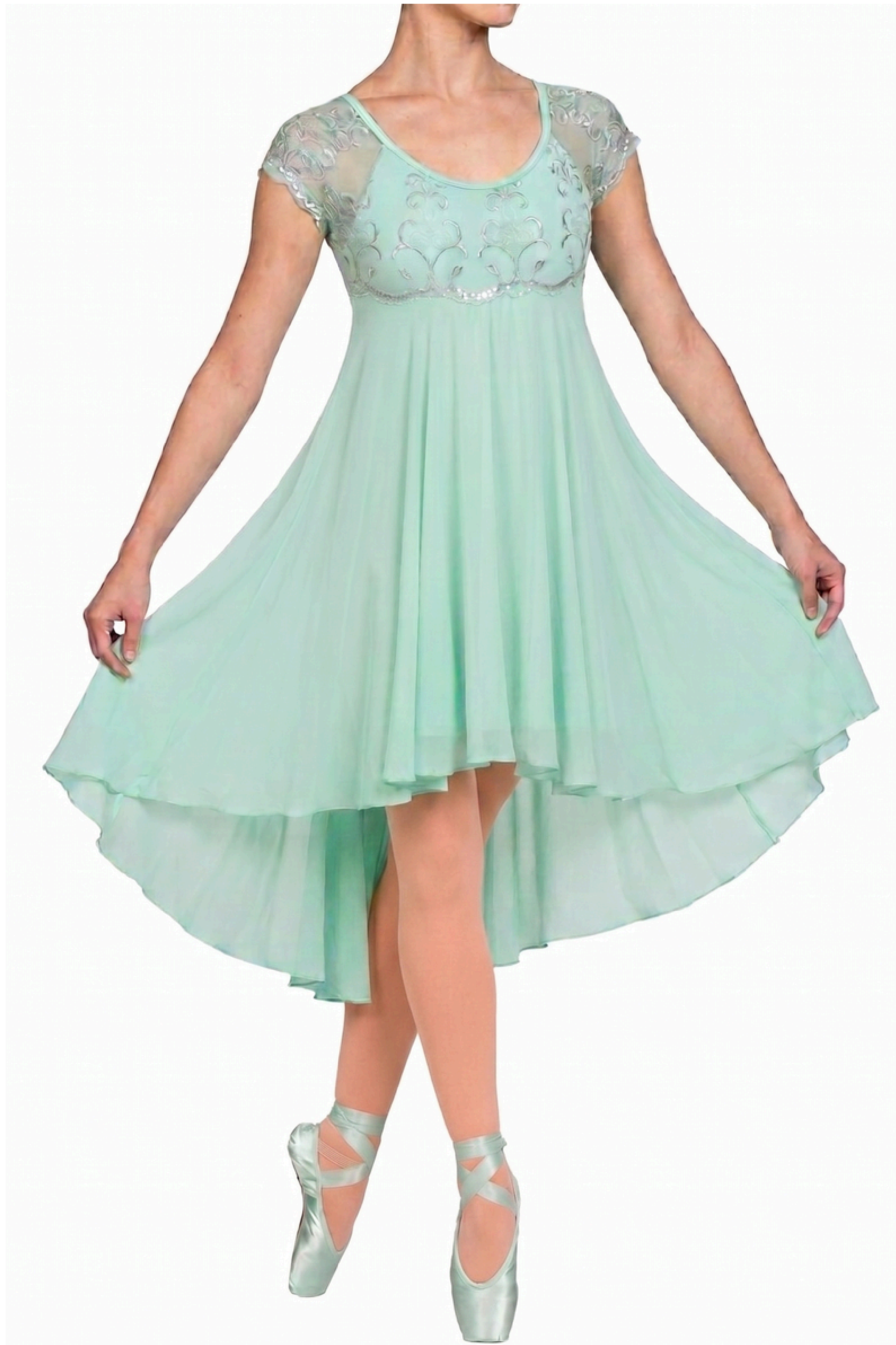
IMAGEM GERADA POR IA MERAMENTE ILUSTRATIVA