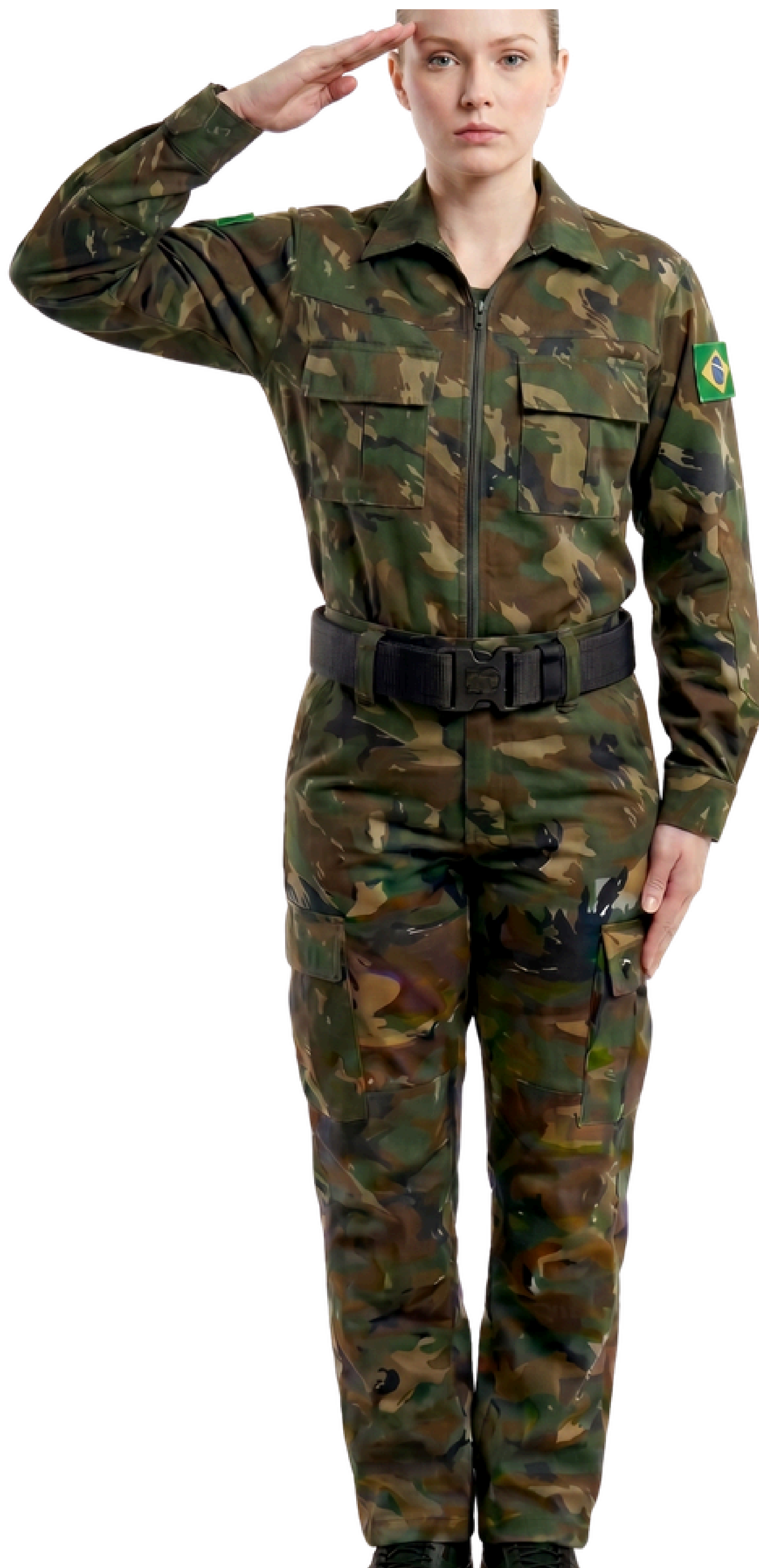
IMAGEM GERADA POR IA MERAMENTE ILUSTRATIVA