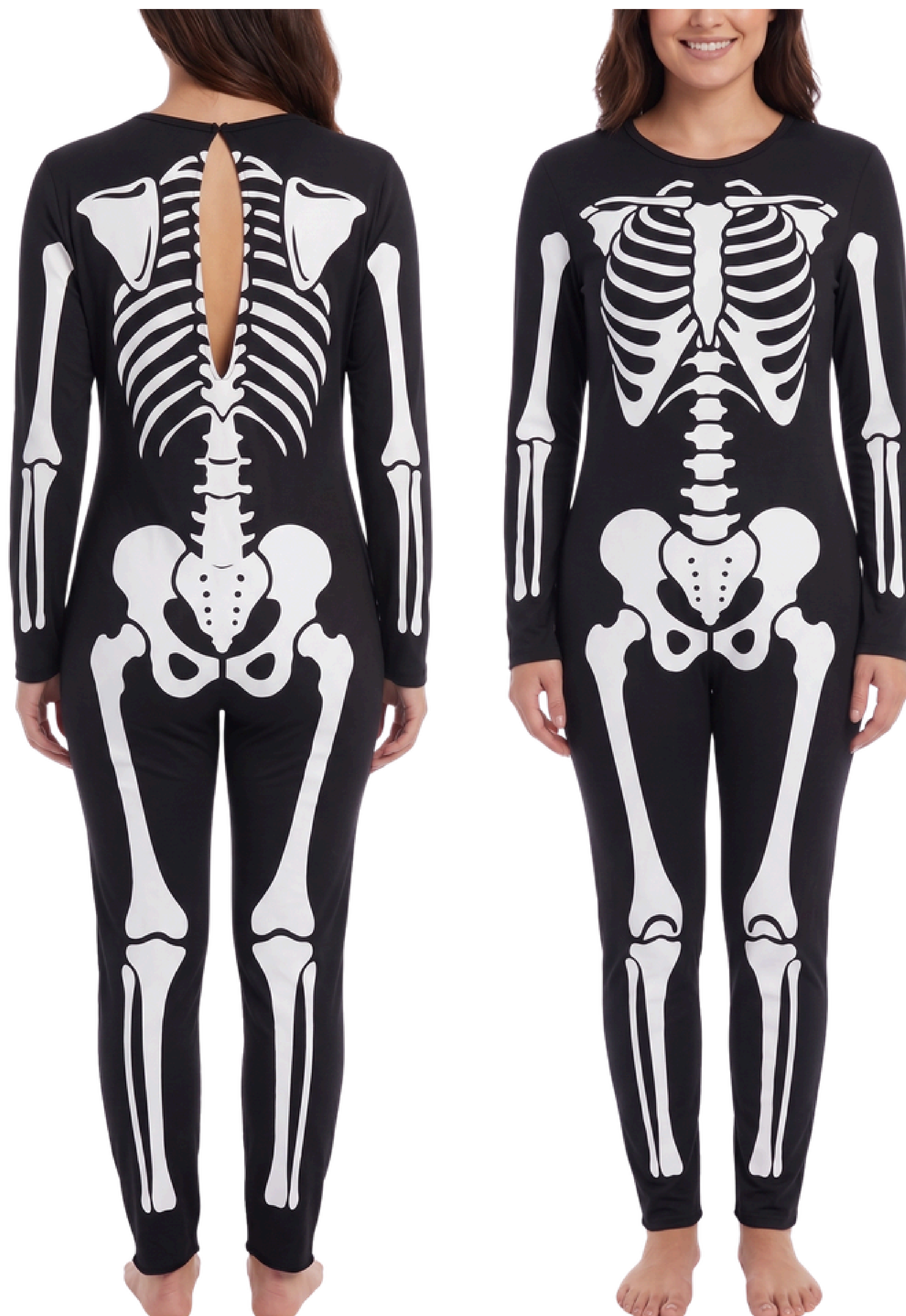
IMAGEM GERADA POR IA MERAMENTE ILUSTRATIVA