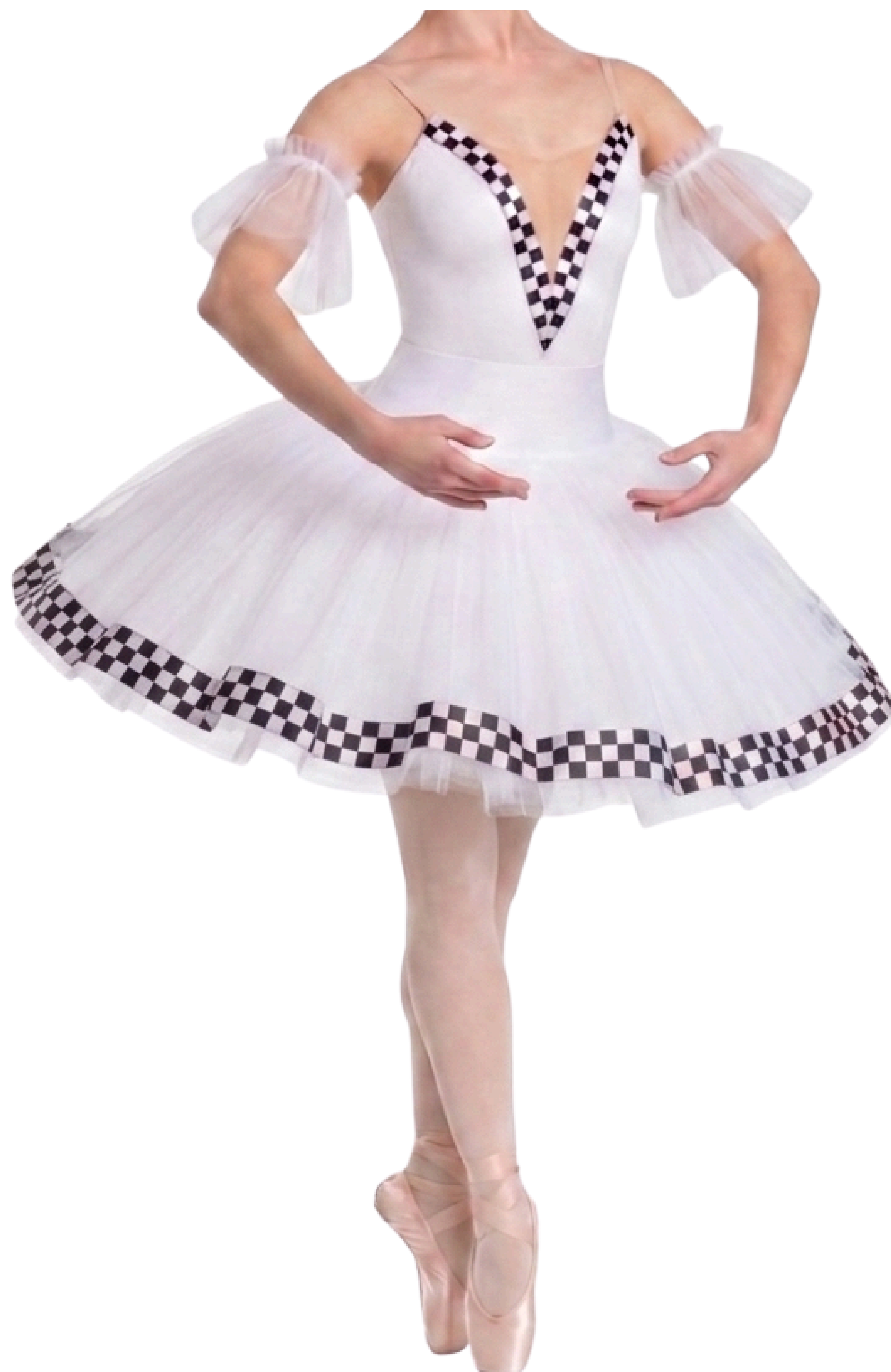
IMAGEM GERADA POR IA MERAMENTE ILUSTRATIVA