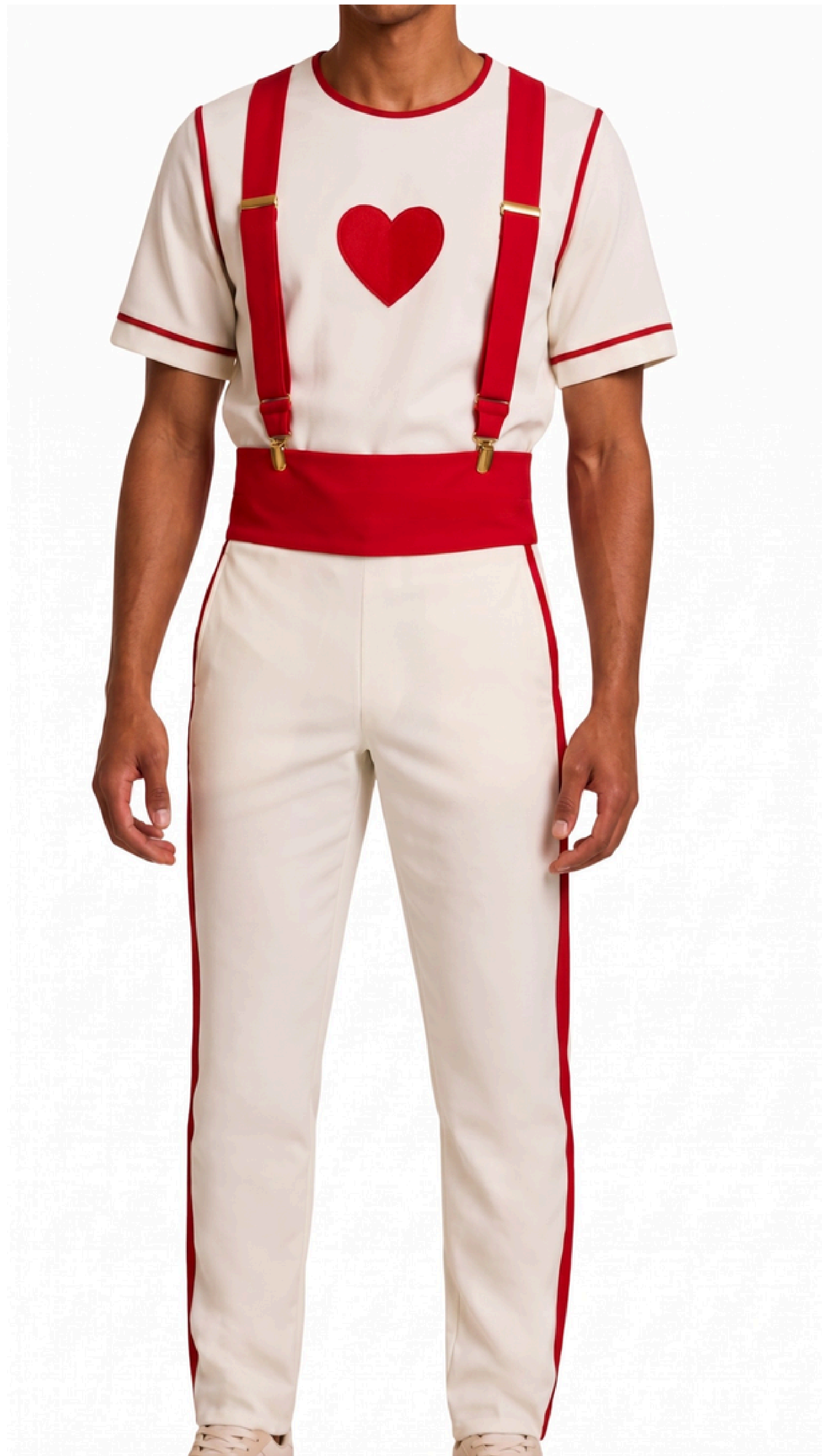
IMAGEM GERADA POR IA MERAMENTE ILUSTRATIVA