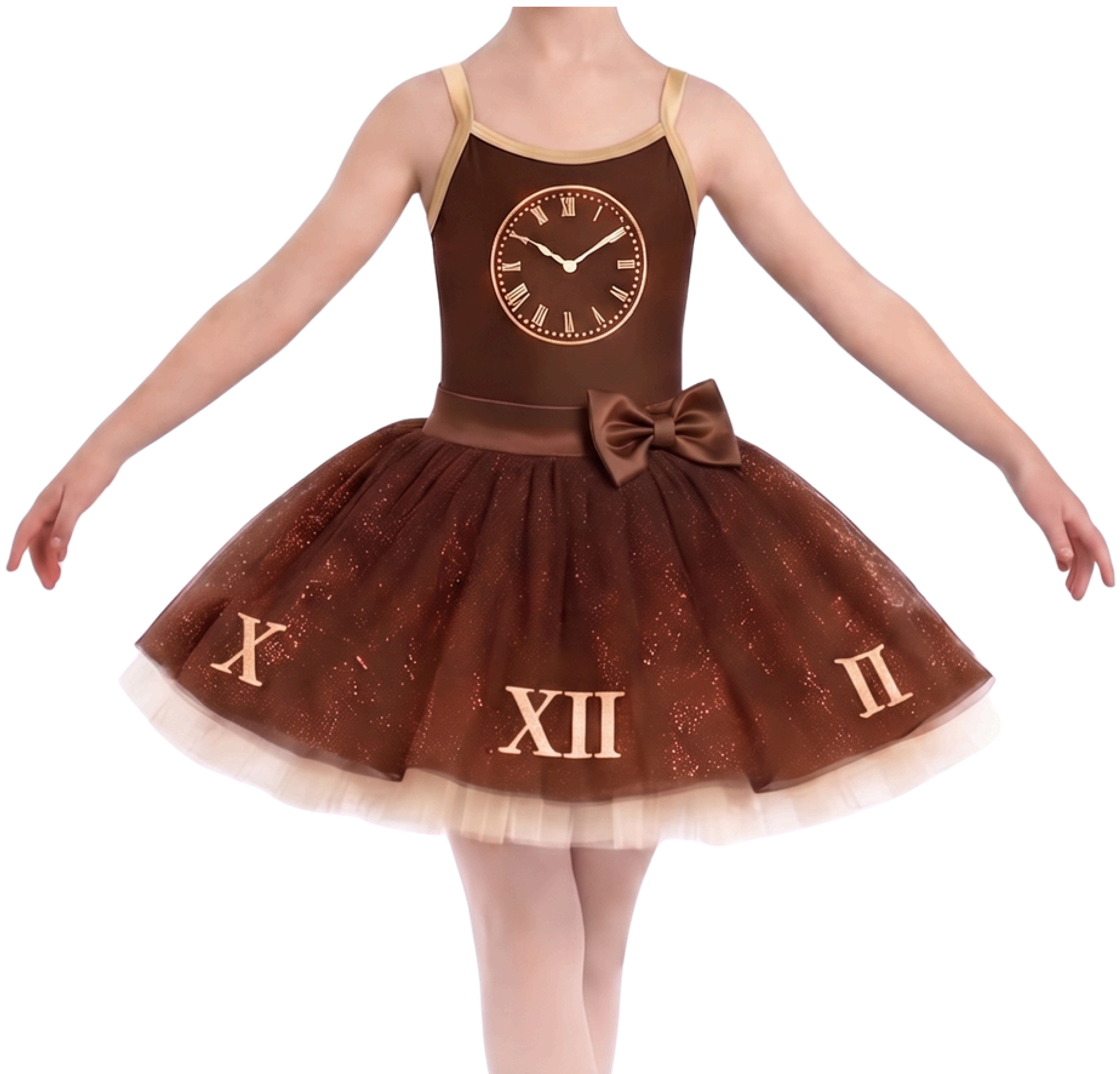
IMAGEM GERADA POR IA MERAMENTE ILUSTRATIVA